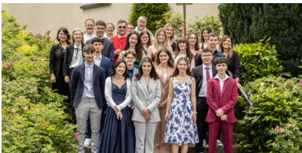
Die Gefirmten nach dem Firmgottesdienst vom Samstag, 15. Juni, 11.30 Uhr