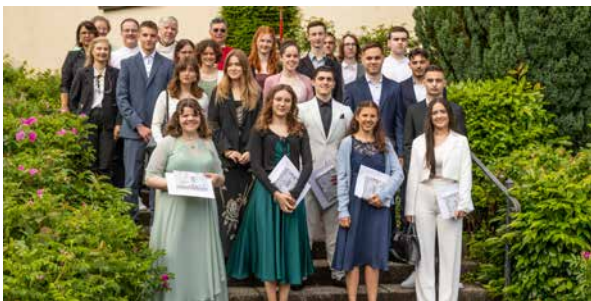
Die Gefirmten nach dem Firmgottesdienst vom Samstag, 15. Juni, 9 Uhr