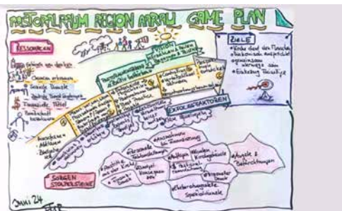
Sieht komplex aus: der Game-Plan von Dvorak

«Aus dem Wilden, das ich nicht fassen kann, kann ich lernen.»