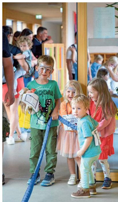
Impressionen vom Sommerfest.