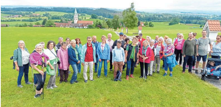
Impressionen der Gemeindefwallfahrt.