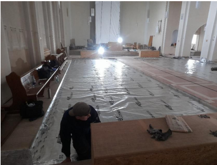
Gegen Feuchtigkeit werden Folien verlegt.