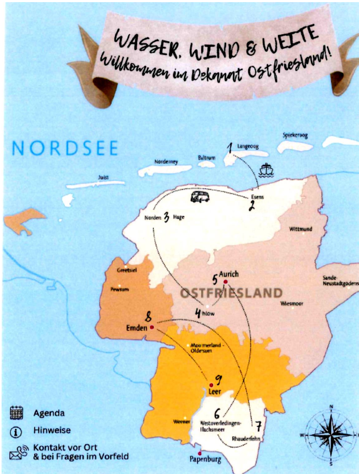
Die Reiseroute von Bischof Dominicus durch Ostfriesland.

32., 33. Sonntag im Jahreskreis B Hochfest Christkönigssonntag, 1. Adventssonntag