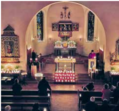
Roratogottesdienst im Kerzenschein

06.30 Roratogottesdienst, anschliessend lädt der Pfarreirat zum «Zmörgelä» im Pfarreisäli ein Opfer zu Gunsten der Universität Freiburg