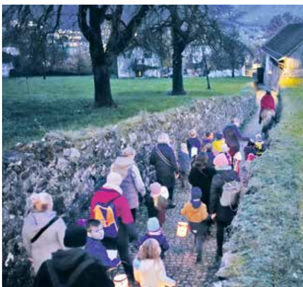
Stimmungsvoller Laternenumzug mit Ross, Reiter, Trompeter und vielen Kinder.

Anschliessend teilten sich die vielen Kinder ein süsses Martinsbrötli mit Freunden oder ihren Begleitpersonen und nach einem warmen Getränk an der DankBar sah man die bunten Laternen in der Dunkelheit verschwinden.