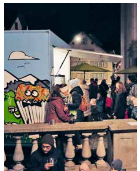
Stärkung an der DankBar