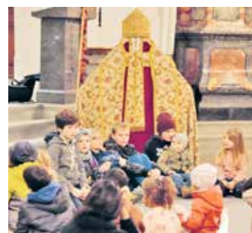
Die Legende des Heiligen Martin wurde in der Pfarrkirche zu Ende erzählt.