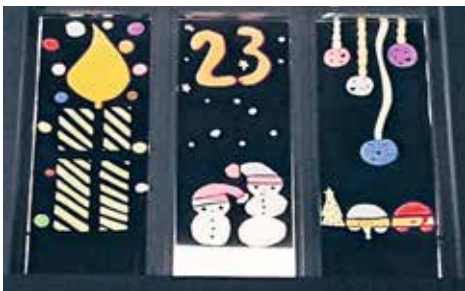
Ein Adventsfenster vom letzten Jahr.

Ab dem 1. Dezember wird während der Adventszeit in unserem Dorf jeden Tag ein Fenster mehr adventlich erstrahlen.