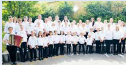
Die Jungjutzer am Mythen erfreuen die Gäste am Samstag um 15 Uhr mit ihren Liedern.

Um 14 Uhr erleben die Kinder ein spannendes Kasperltheater mit Gabriela Müller. Um 15 Uhr treten die Jungjutzer am Mythen auf die Bühne. Danach können die Kinder sich an verschiedenen Glücksspielen versuchen.