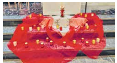
Gottesdienst der Frauengemeinschaft zum Thema Licht...