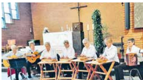
Zithergruppe Schwyzerholz im Sonntagsgottesdienst.