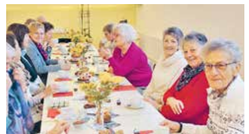
und anschliessende Kaffeetafel in der Pfarreistube.