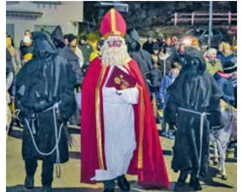
Einzug des Samichlaus

Ebenfalls am 1. Adventssonntag am 1. Dezember abends um 17.00 Uhr besammeln