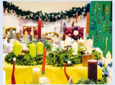
Bazar mit reichhaltigem Angebot.

Am Sonntag, 24. November um 9 Uhr wird die Eucharistiefeier mitgestaltet