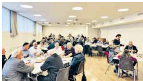
Das Minileitungsteam durfte am Gedenksontag im Chilekafe viele Gäste bewirten.