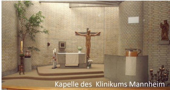
Kapelle des Klinikums Mannheim

In der Kapelle (Haus 7) des Klinikums finden regelmäßig Gottesdienste statt. Katholische Gottesdienste werden sonntags um 10.30 Uhr und montags und freitags jeweils um 18.00 Uhr gefeiert.