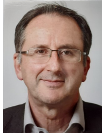
Helmhagen Rudolf, 66 J., Präsident des Landgerichts, Falkenring 13