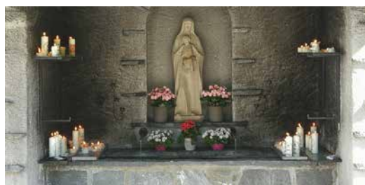
Gnadenkapelle beim Badbrünneli.