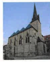
Birkungen St. Johannes d. Täufer