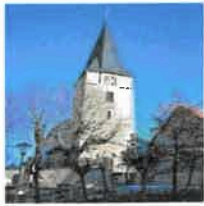
Breitenbach St. Margaretha