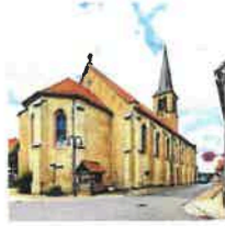
Beuren St. Pankratius