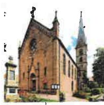
Wingerode St. Johannes d. Täufer