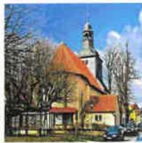
Breitenholz St. Mariä Heimsuchung