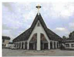
Leinefelde/Südstadt St. Bonifatius