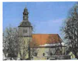
Lfd. St. Maria Magdalena Alte Kirche