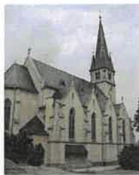
Lfd. St. Maria Magdalena Pfarrkirche