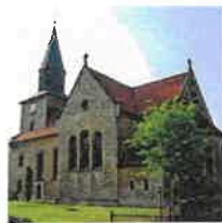
Kallmerode St. Martin