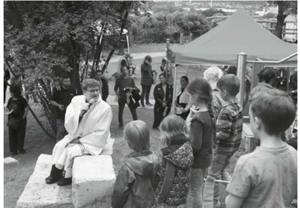
Freiluftgottesdienst auf dem Außengelände von St. Clemens.