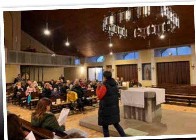
Auftakt in der Kirche

Text und Foto: Mirjam Liesen, KiTa-Leitung