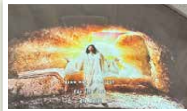
„Denn nur er besiegt für alle Zeit die Zeit“. Das Video wurde an der Wand der Apsis eingespielt.

Er ist Anfang und Ende zugleich, er macht uns arm und unendlich reich. Denn er ist die Kraft und die Ewigkeit. Und nur er besiegt die Zeit. Denn er ist die Kraft und die Ewigkeit.