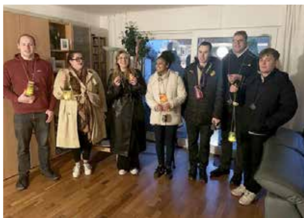
Leiterrunde hat sich zum Singen „ihres“ Martinsliedes aufgestellt