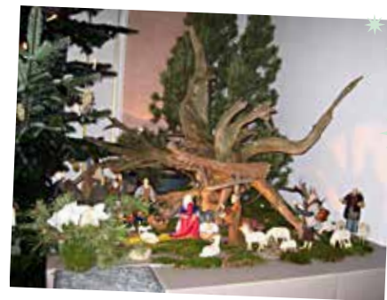
(Kirchenkrippe St. Liborius 2012)