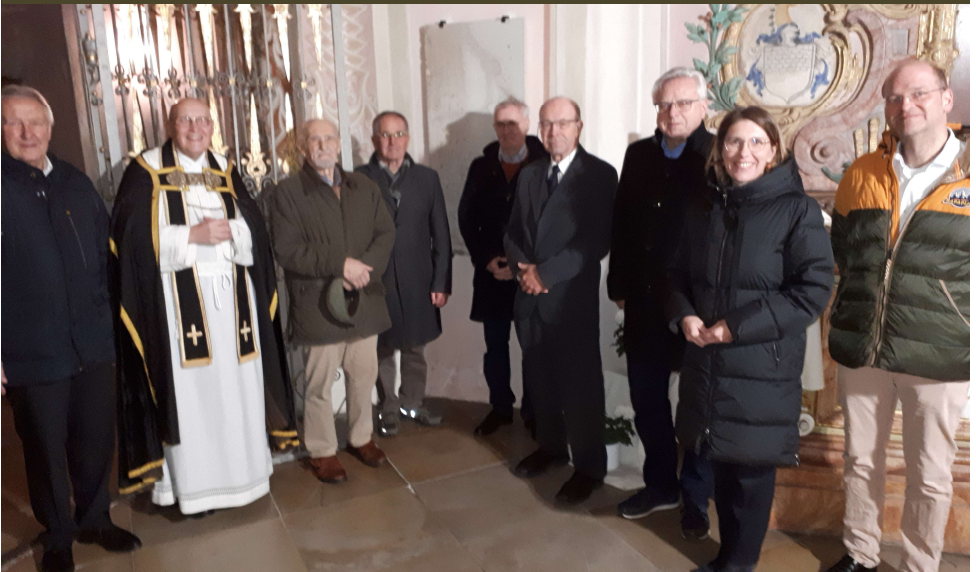
Feierliche Enthüllung des Grabsteins am 16. November 2024 mit zahlreichen Ehrengästen

Oh, der du aus einem Nichts dies Alles bewirkt hast, mache daraus wieder etwas Größeres, damit es in deinem Licht das ewige Licht sieht!