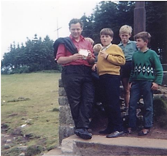
Auf einer Freizeit mit Kindern aus Christkönig

wanderte gern, fuhr Fahrrad, spielte Gitarre, hatte viele Ideen und war warmherzig, ideale Voraussetzungen, um schnell mit Kindern in Kontakt zu kommen.