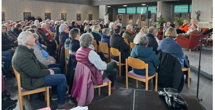
Erste Glücksmatinee in der Kulturkirche Silberg.