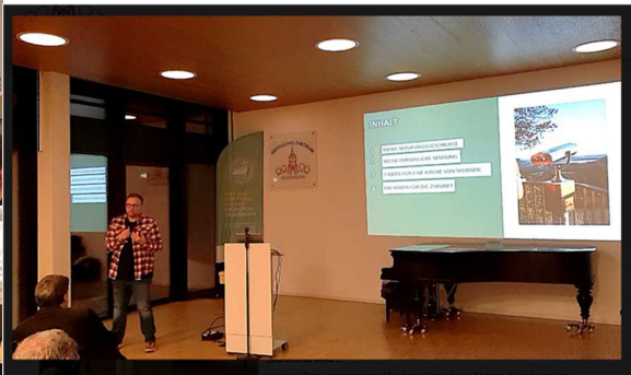
Vortrag am 20.02. Freude an Gott – Auf dem Weg zu einem lebendigen Glauben.