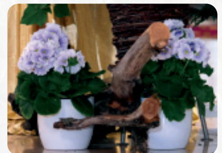
Décoration de Pâques à Reichstett.