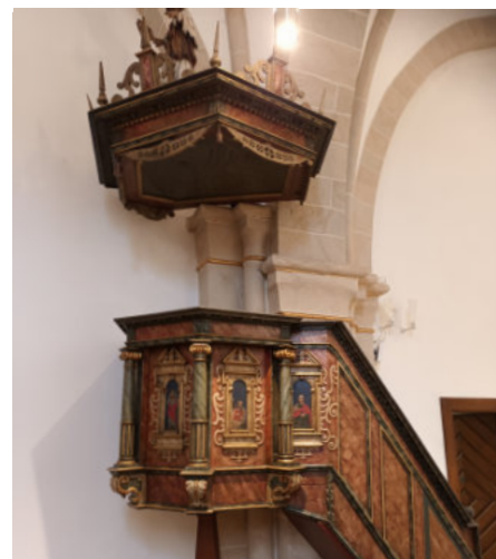
Kanzel in der Pfarrkirche St. Dionysius unten: Inschrift im Kanzelfuß