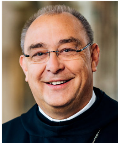
Dr. Dominicus Meier OSB, designierter Bischof von Osnabrück

gungen durch den Kopf, wie ich als Bischof die große Diözese mit ihren vielen einzelnen Regionen in den Blick bekommen und vor allem mit Ihnen in den Gemeinden und Einrichtungen in Kommunikation kommen kann. Ich suche nach Formen, wie ich dies verlässlich tun kann. Ich glaube, dass Besuche und Begegnungen vor Ort dazu sehr wichtig sind und möchte diese zeitnah beginnen. Ich spüre ein großes Interesse in mir, die reiche Vielfalt des Bistums Osnabrück kennenzulernen, vor allem aber die Menschen.