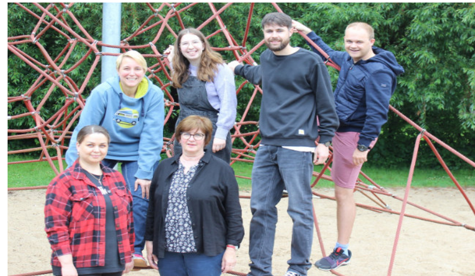
Ein Teil des Teams des Kindertreffs

Der offene Kindertreff ist ein Ort der Vielfalt. Kinder und Jugendliche aus unterschiedlichen sozialen, kulturellen und familiären Hintergründen finden hier zusammen. Die Mitarbeiter:innen fördern aktiv die Integration und Inklusion, indem sie eine Atmosphäre des Respekts und der Offenheit schaffen. Sie setzen sich dafür ein, dass jeder junge Mensch, unabhängig von Herkunft oder sozialem Status, die gleichen Chancen und Möglichkeiten erhält. Sie bieten den jungen Menschen einen sicheren Rückzugsort. Sie hören zu, geben Rat und vermitteln bei Bedarf weiterführende Hilfe. Ihre Präsenz und Unterstützung können