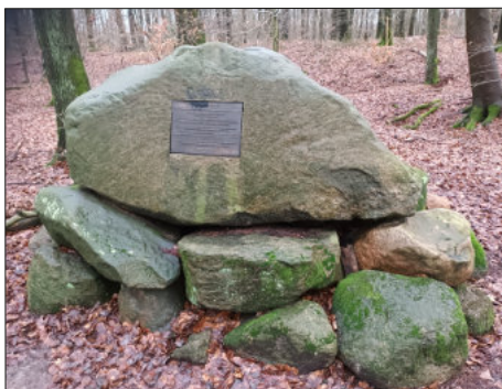
Schwedenschanze: Gedenkstein auf dem Schinkelberg in Belm (nahe Bergstraße) mit Inschrift und Beschreibung der Befestigungsanlage

lich gelegene Kirchspiel Belm, errichtete die heute noch auf dem Schinkelberg zu erahrende „Schwedenschanze“. Auch er lagerte auf Asstrup. Rund um Belm lag ein Heer von 4.000 schwedischen Soldaten.