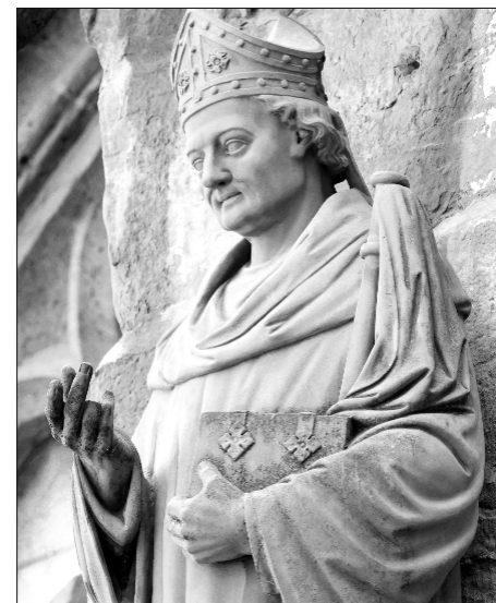
Hl. Bischof Martin von Tours Skulptur am Erfurter Dom St. Marien

Das Teilen seines Mantels, eine kleine Geste im Vergleich zu den großen Taten, die er später vollbringen sollte, steht sinnbildlich für das, was uns als Christen auszeichnen sollte: