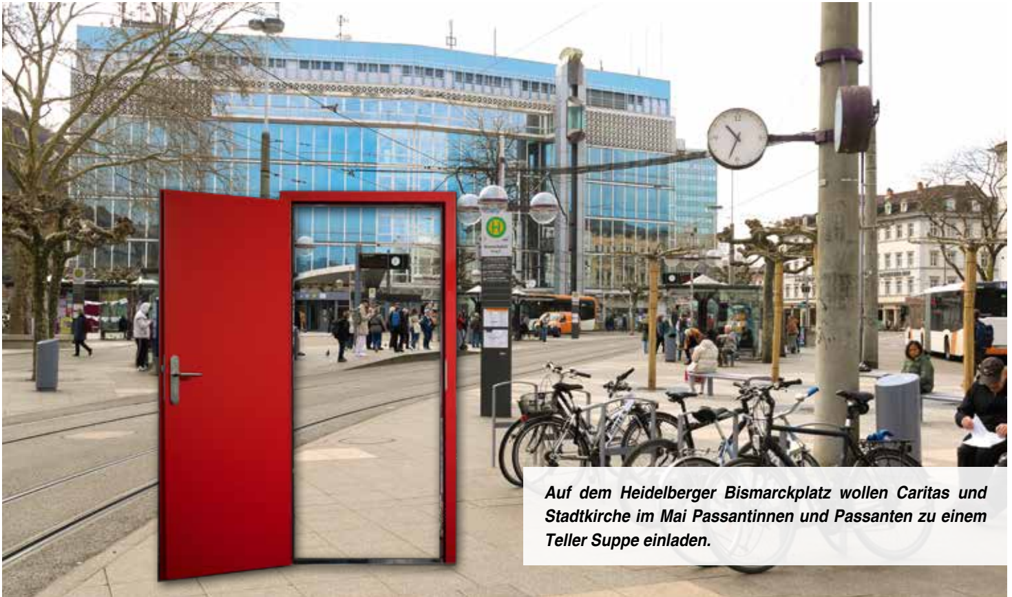
Auf dem Heidelberger Bismarckplatz wollen Caritas und Stadtkirche im Mai Passantinnen und Passanten zu einem Teller Suppe einladen.