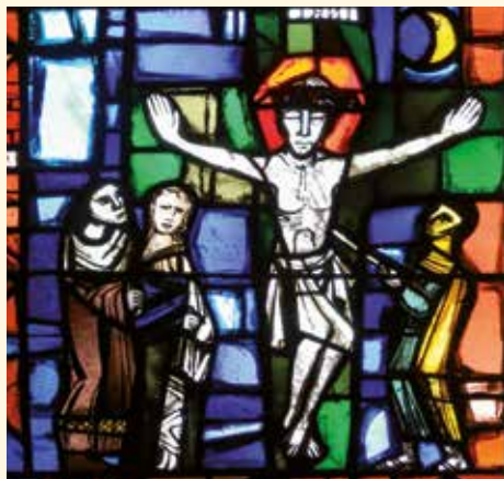
Die Kreuzigung Jesu