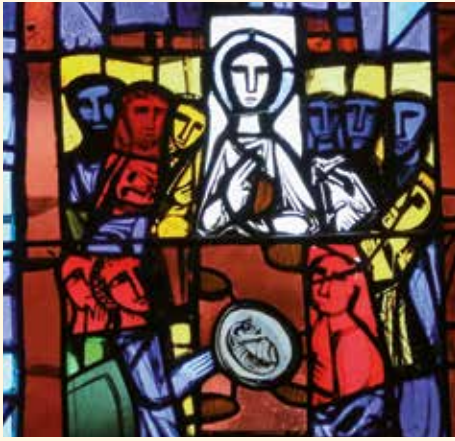
Das Letzte Abendmahl