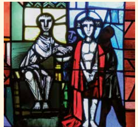
Jesus vor Pilatus