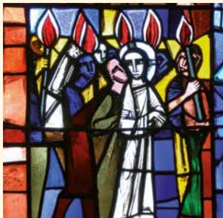
Die Gefangennahme Jesu