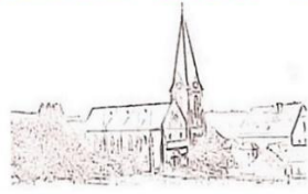
St. Antonius Maßweiler