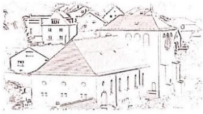
St. Margaretha Thaleischweiler-Fröschen