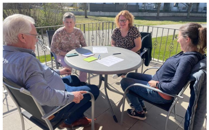
Klausurtagung der Räte am 21./22.3. im Priesterseminar in Speyer