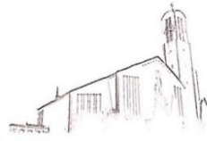
St. Peter Petersberg