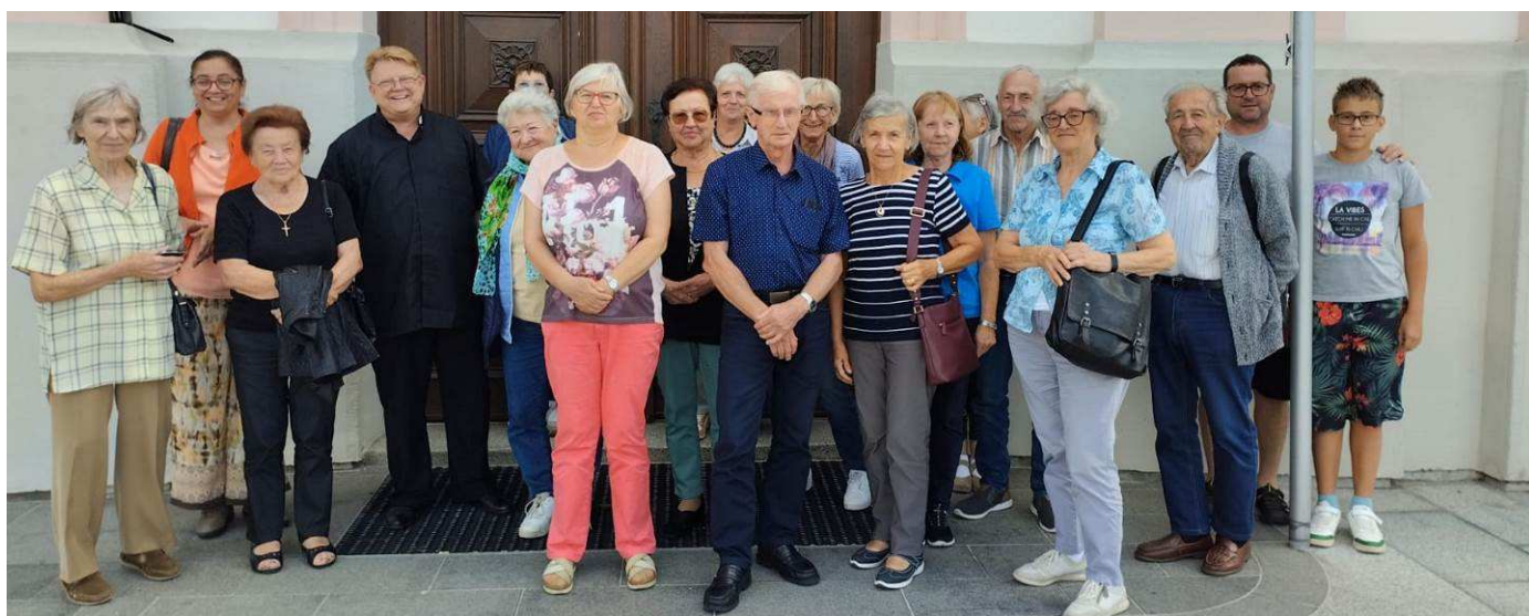
Wallfahrt nach Mariazell, am 03.08.2024

JEDEN MITTWOCH UM 09:00 UHR WIRD IN DER PFARRKIRCHE LAUDES GEBETET!