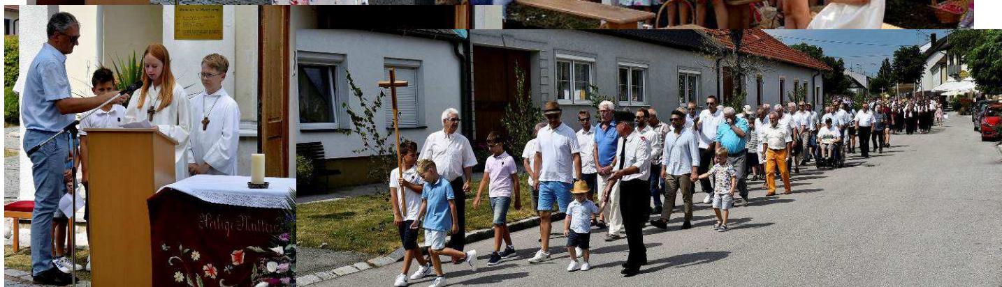
Kirtag Hochstraß, am 28.07.2024