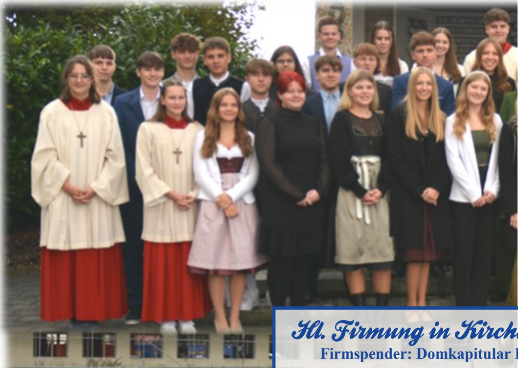
Hl. Firmung in Kirchdorf Firmspender: Domkapitular