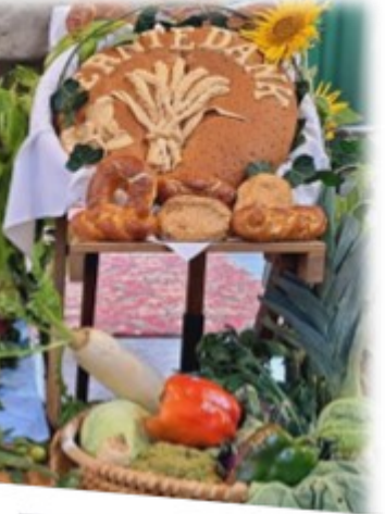
Erntedank am 22. September 2024 in Kirchdorf