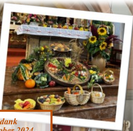
Erntedank am 6. Oktober 2024 in Julbach