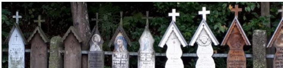
Totenbretter im Bayerischen Wald