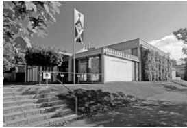
Kath. Pfarrgemeinde St. Bernhard