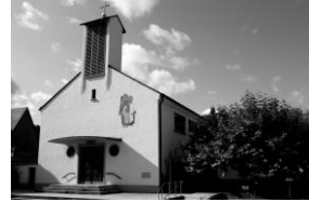
mit Hl. Familie/ Keltern