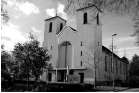
Kath. Pfarrgemeinde St. Antonius