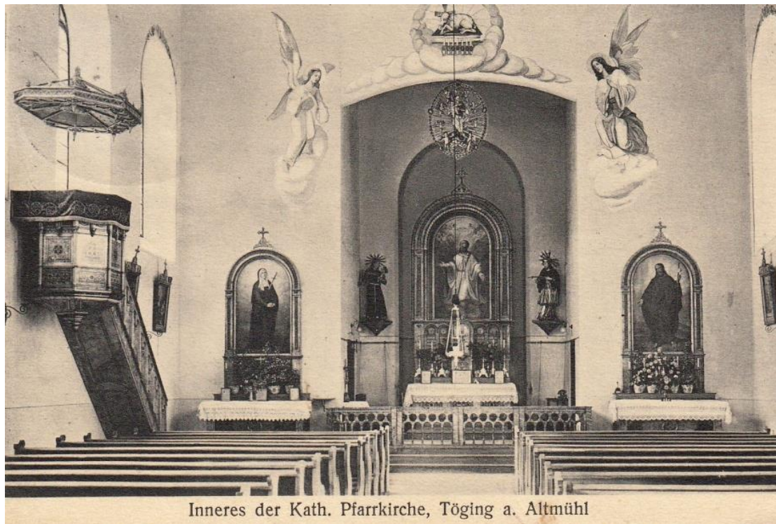
Inneres der Kath. Pfarrkirche, Töging a. Altmühl

Der Innenraum der Kirche war ursprünglich sehr einfach und die Einrichtung stammte ganz aus dem 19. Jahrhundert. Diese alte Ansichtskarte zeigt das Innere der Töginger Pfarrkirche vor dem 2. Weltkrieg.