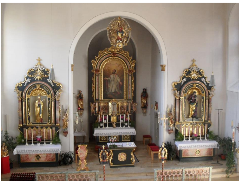
Der heutige Innenraum der Pfarrkirche Töging.

Die herrlichen Figuren der heutigen Kirche aber stammen fast durchwegs aus der uralten Töginger Peterskirche, der heutigen Friedhofskirche und wurden zum großen Teil erst im vergangenen Jahrhundert in die Kirche St. Bartholomäus gebracht.