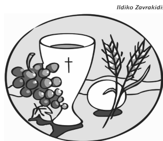
Brot und Wein, Jesus selbst: Nahrung auf dem Lebensweg.