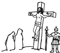
Karfreitag: Das Leben hinzeben.

14.00 Uhr Die Feier vom Leiden und Sterben Christi in Haibühl (Wortgottesdienst - Kreuzverehrung - Kommunionfeier)