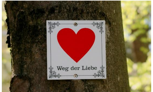
Weg der Liebe Christiane Raabe, Pfarrbriefservice

In einem ersten „Rundgang“ beginnt der Weg, auf dem die Kinder sich mit Jesus und seinem großen Liebesbeweis vertraut machen.