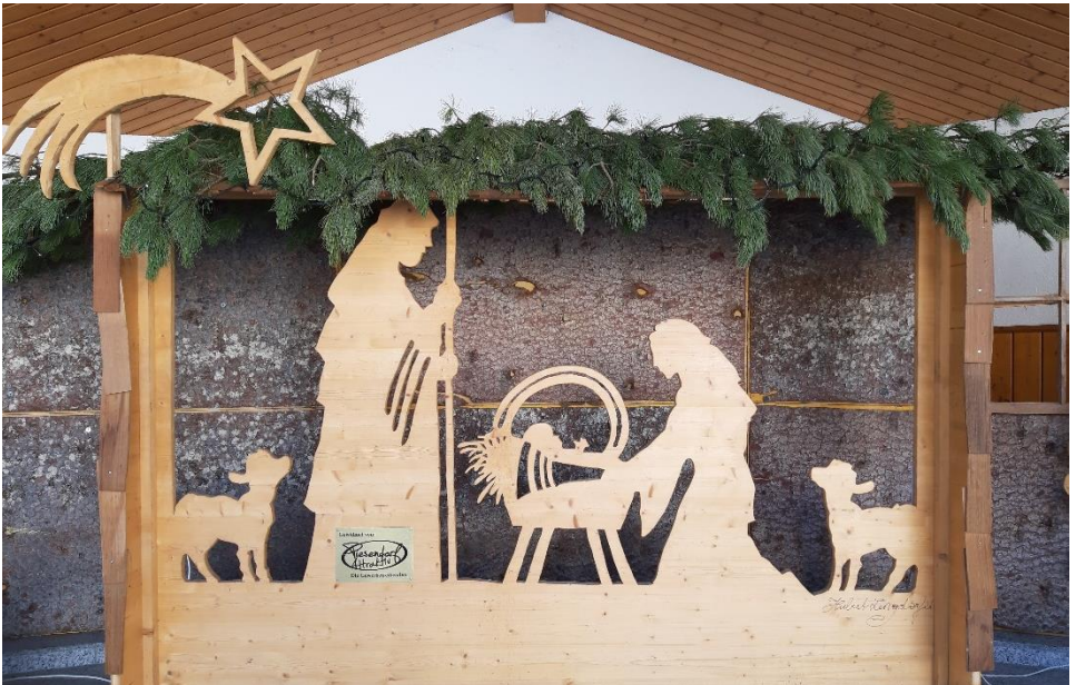
Weihnachtskrippe der Gemeinde Piesendorf

Weihnachten ist das Fest der Geburt Jesu Christi in Bethlehem.