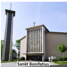
Sankt Bonifatius Ihringshäuser Str. 3

Sozialbüro Sankt Joseph : Marburger Straße 87, 34127 Kassel (Gemeindehaus), Tel: 0561 - 8 61 76 89; Fax: 0561 - 8 56 90, geöffnet Donnerstag, 10.30 bis 13 Uhr