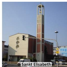
Sankt Elisabeth Friedrichsplatz 13