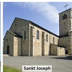
Sankt Joseph Marburger Str. 87