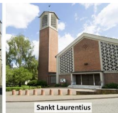
Sankt Laurentius Weidestr. 36