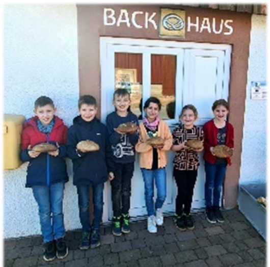
Text und Bilder: Milena Kraus