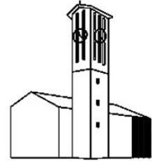
St. Johannes Bosco