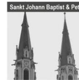
Sankt Johann Baptist & Petrus