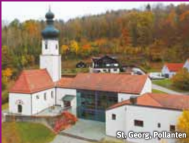
St. Georg, Pollanten