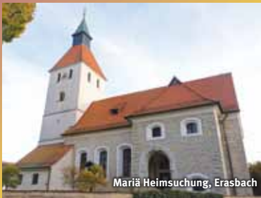
Mariä Heimsuchung, Erasbach