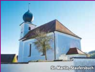
St. Martin, Staufersbuch