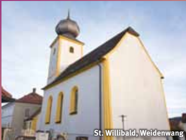
St. Willibald, Weidenwang