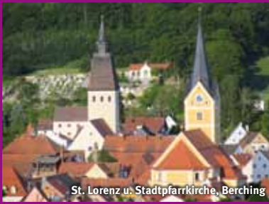
St. Lorenz u. Stadtpfarrkirche, Berching