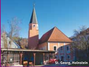
St. Georg, Holnstein