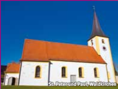
St. Peter und Paul, Waldkirchen