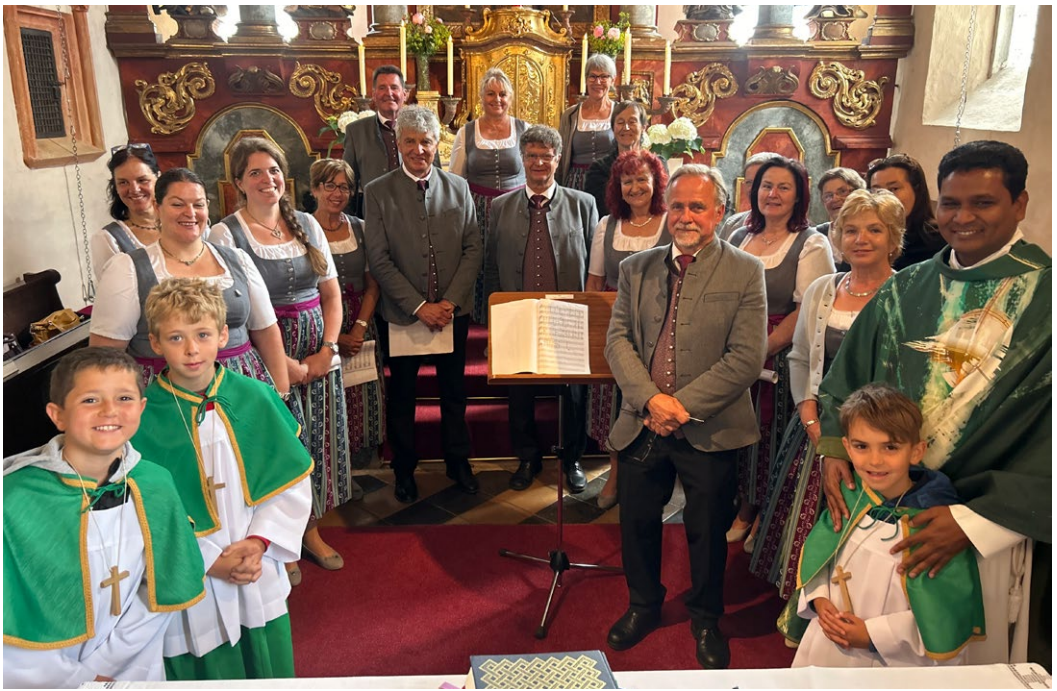
Die Singgemeinschaft Guttaring gestaltete den Gottesdienst am 9. Juni 2024.