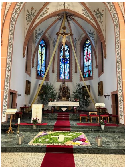
4. Altar: Pfarrteam Oberthal