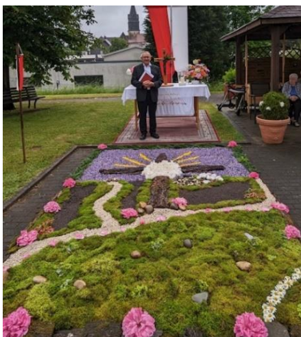
3. Altar: Seniorenheim St. Stephanus

PGR Gronig PGR Güdesweiler Pfarrteam Oberthal