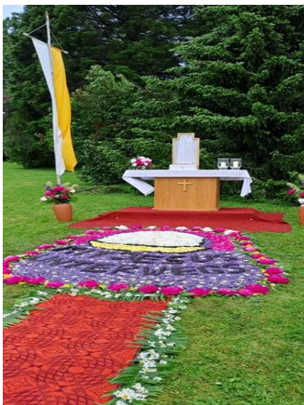
2. Altar: PGR Gronig