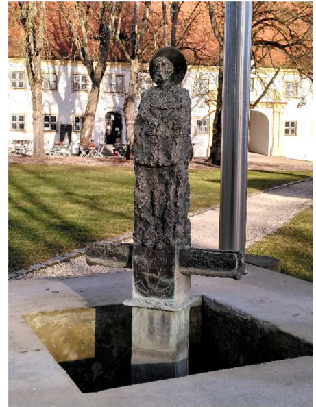
Bernhard-Brunnen im Kloster von Oberschönefeld.