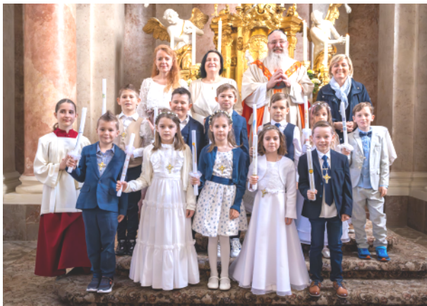
Erstkommunion am 7. April