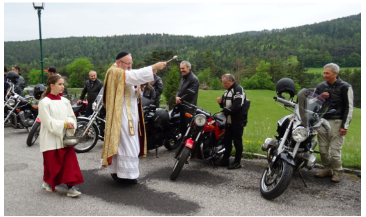
Motorradsegnung am 1. Mai