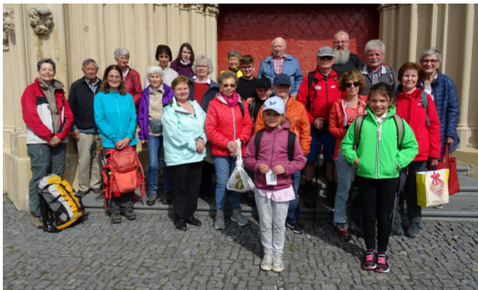
Wallfahrt Mariazell 11. Mai