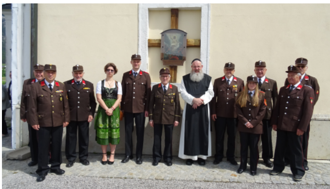
Florianimesse am 5. Mai