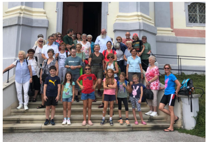
Mariahilfberg 31. August