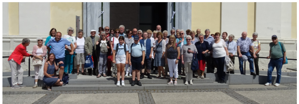
Pfarrausflug Maria Taferl und Artstetten 6. Juli