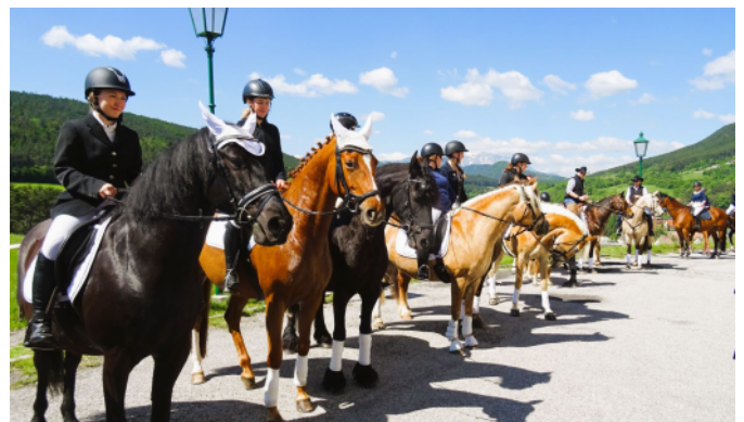
Georgiritt am 9. Mai