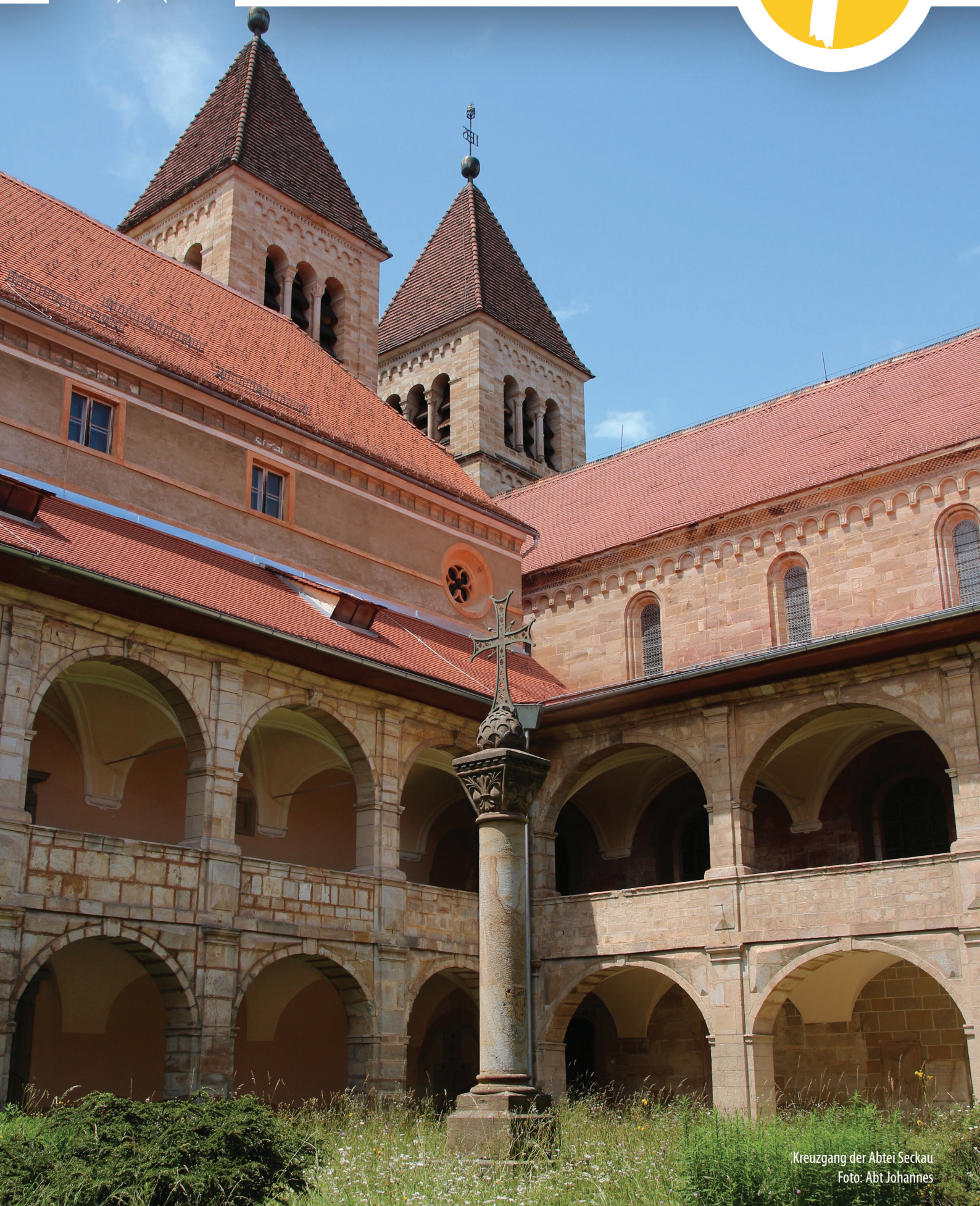
Kreuzgang der Abtei Seckau