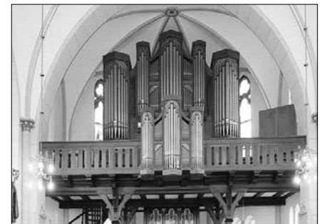
Der Gemeindeausschuss Friesoythe

Wir freuen uns auf viele Konzertbesucher ... und Kaffeegäste.