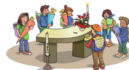
ImageOnline 04/2021 Grafik: Andrea Naumann

Möge das neue Schuljahr dir Erfolg bringen und dein heißer Draht nach oben an glücklichen und an schweren Schultagen nie unterbrochen sein!