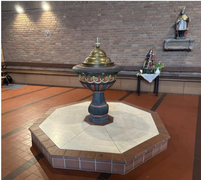
Taufstein aus der zweiten Zewener Pfarrkirche von 1819

Gottes Segen für die Kinder und deren Familien!