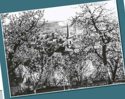
Festgehalten und aufgeschrieben von Georg Fusenig