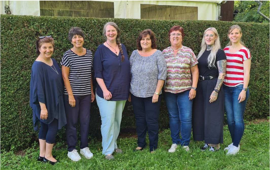
Die Pfarrsekretärinnen von links nach rechts: