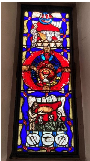
Eucharistiefester in der Kapelle St. Pankratius

In diesem Jahr sind es genau 50 Jahre seit der Renovation und Erweiterung der Altwieslocher Pankratiuskapelle. Daran wurde in einem feierlichen Gottesdienst dankbar gedacht. Am Pankratiusfest, am 12. Mai des Jahres 1974, weihte