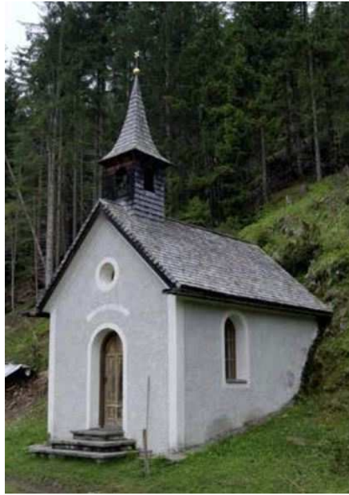
oben links: Ranerkapelle, oben rechts: Pircherkapelle, unten: Kapelle in Gschwendt

Lourdes-Grotte im Markte Sillian möchte ich heute in aller Kürze berichten, in der Absicht, auch anderswo, wo es ausführbar ist, edle Herzen für diese besondere und sehr nachahmenswerte Art der Marienverehrung zu begeistern. Vor allem möchte ich bemerken, dass diese Lourdes-Grotte ihre Entstehung dem Eifer und der Opferwilligkeit des dortigen Seelsorgers und frommer Bürger verdankt. Diese historische Notiz beweist uns, wie die Annakapelle mit ihrer Lourdes-Grotte für die Pfarrangehörigen immer wichtig war. Aus diesem Grund wollen wir sie in