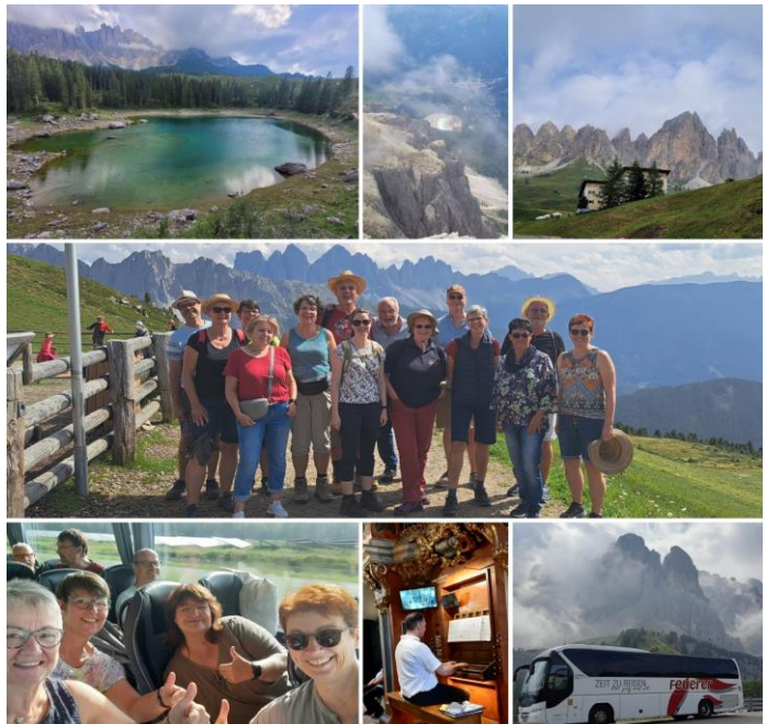
Chorfahrt Kirchenchor St. Briktius, Kues