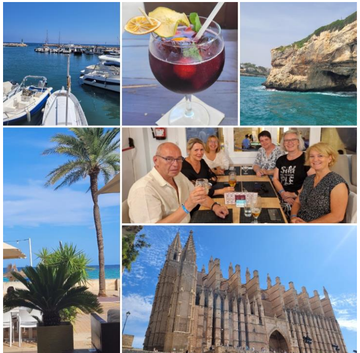
Auszeit Familiengottes- dienstkreis Kues