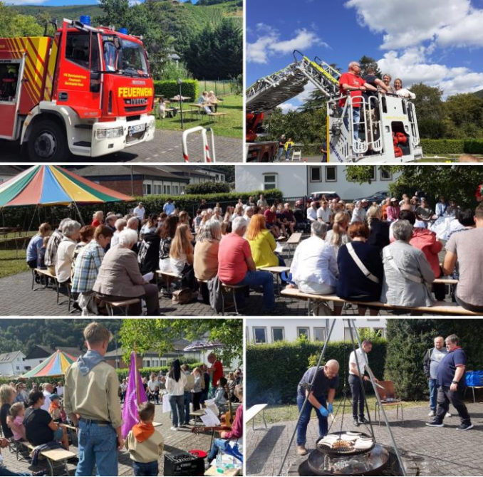
Sommerfest auf der Pfarrwiese