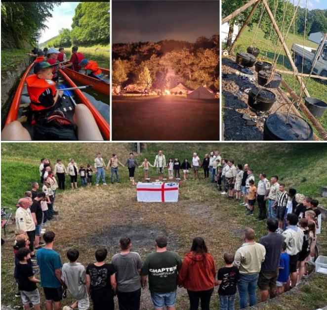
Sommerlager der Pfadfinder DPSG Westgoten Kues