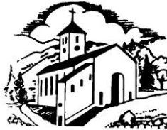
St. Valentin Langenbrand