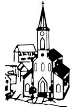
St. Wendelin Weisenbach