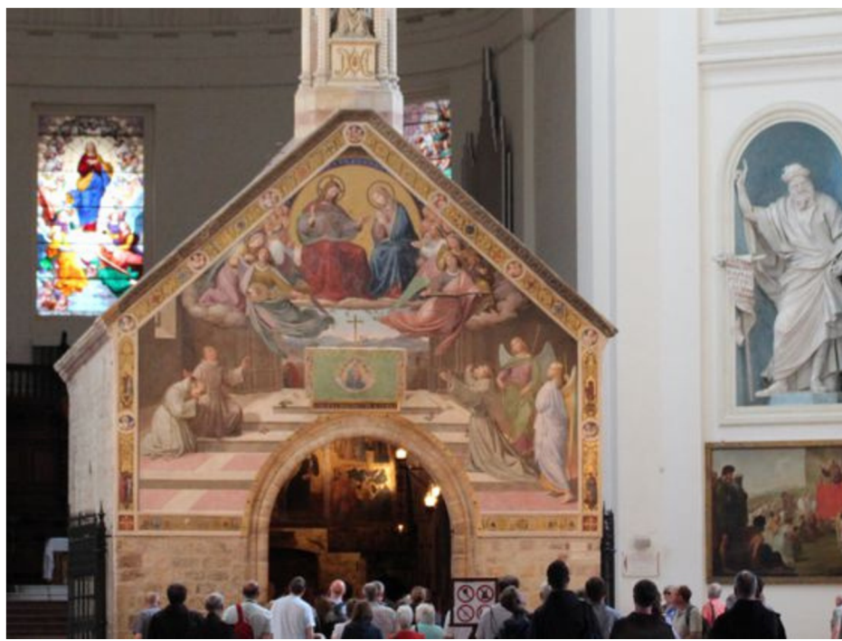
Eingeborgen in der großen Basilika. Das Kirchlein Portiunkula, die Keimzelle des Franziskanerordens.

auf den Besuch einer Pfarrkirche. Um den Ablass zu empfangen, betet man am 2. August oder dem folgenden Sonntag in einer Kirche eines franziskanischen Ordens oder in einer Pfarrkirche das "Vater unser" und das Glaubensbekenntnis. Am gleichen Tag, oder einige Tage davor bzw. danach legt man die hl. Beichte mit entschlossener Abkehr von jeder Sünde ab, empfängt die hl. Kommunion und verrichtet ein Gebet auf Meinung des Heiligen Vaters (Ein Vater unser, ein Ave Maria und ein weiteres Gebet).