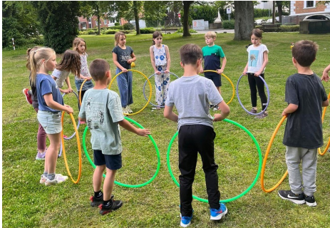
Die Kommunionkinder konnten zusammen draußen spielen, bis es dunkel wurde.