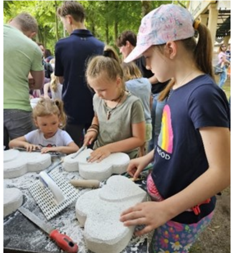
Die Kinder konnten an dem Tag auch kreativ werden.

Text: Anna Wittemeier