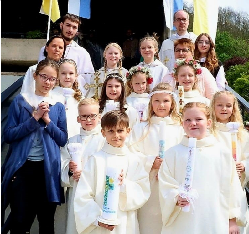
Die Kommunionkinder von St. Walburga 2024