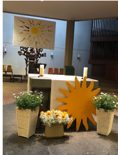
Der Kirchenschmuck in St. Peter und Paul.

reitungszeit. Am Ende des Gottesdienstes überraschten die Eltern ihre Kinder mit einem Lied und eine PowerPoint Präsentation.