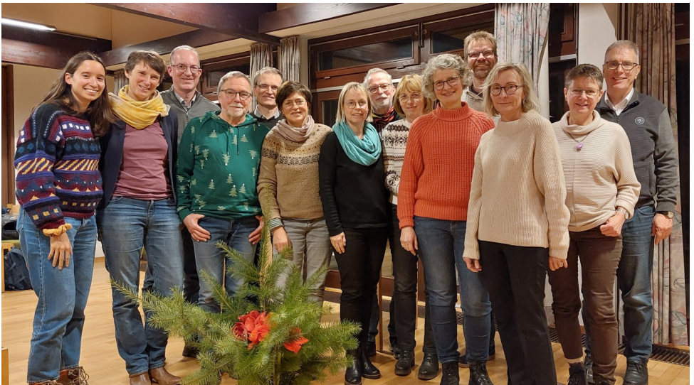
Das Foto stammt von der Gründungsversammlung und zeigt alle damals anwesenden Mitglieder des Vereins.

Unsere neue Kontonummer lautet: DE92 4905 1285 0060 0231 57 (bei der Sparkasse Bad Oeynhausen – Porta Westfalica).