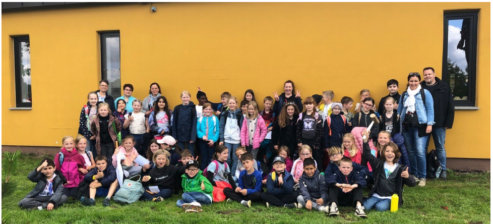
Alle Kommunionkinder aus dem Pastoralen Raum WerreWeser haben zusammen einen Ausflug ins Bibeldorf nach Rietberg gemacht.