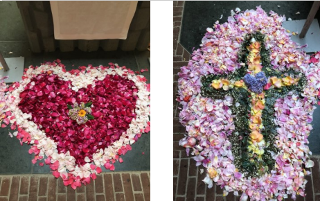
Die Blumenteppeiche an Fronleichnam 2024

Flink sortierten die Kommunionkinder die gespendeten Blüten für Fronleichnam nach Farben. Das Thema der Erstkommunion sollte auf jeden Fall im Bild aufgegriffen werden - da waren sich alle Kinder einig. Vor dem Altar entstand somit eine große Sonne mit vielen Strahlen. Der Altarraum wurde anschließend mit Herzen und Kreuzen verziert.