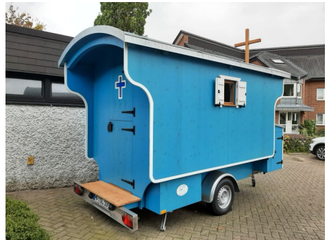
Der Schäferwagen steht am 20.07.24 auf dem Autohof Porta Westfalica.