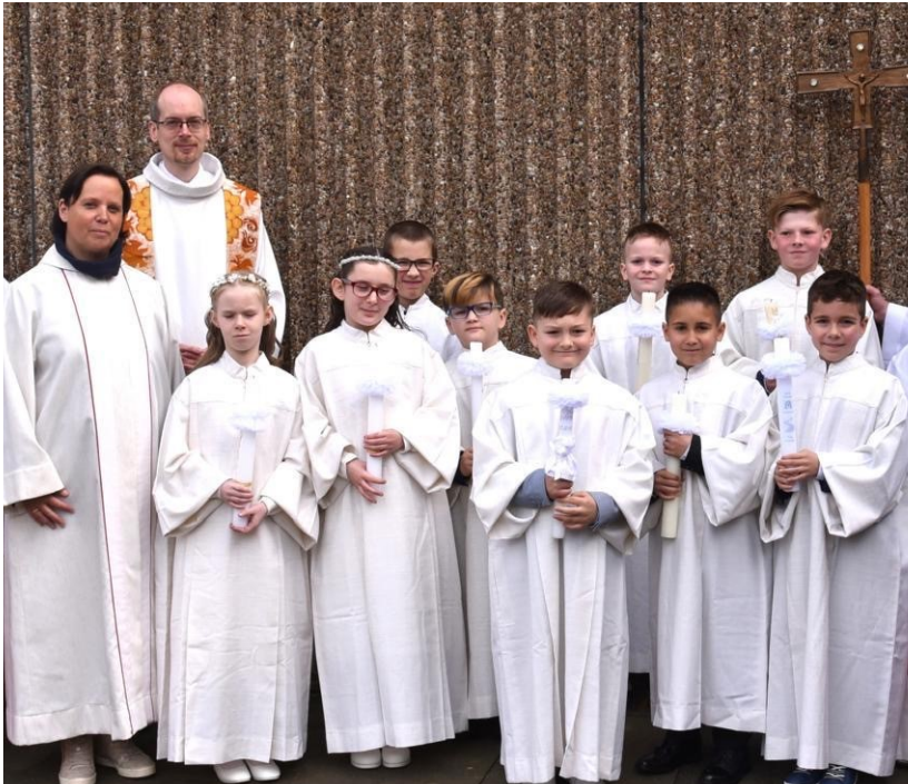
Die Kommunionkinder von Heilig Kreuz