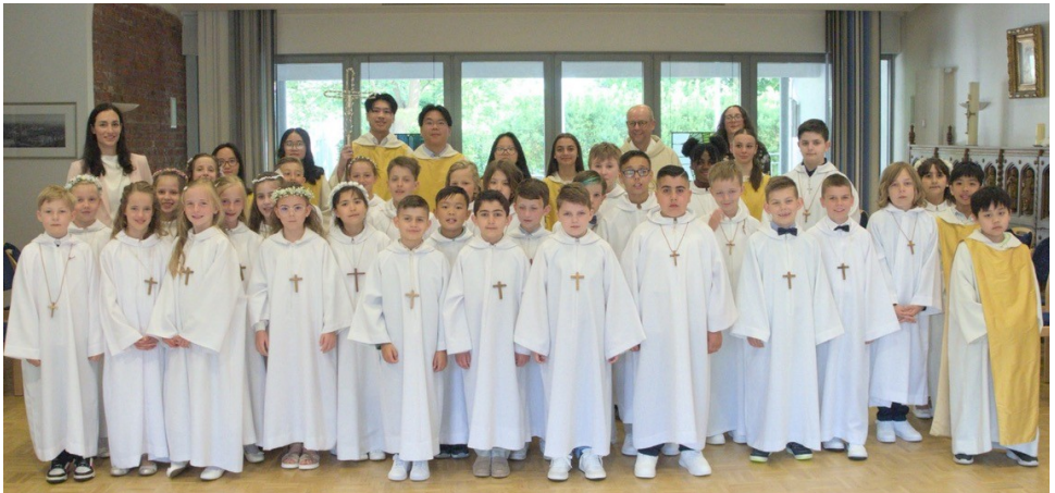
Die Kommunionkinder von St. Peter und Paul