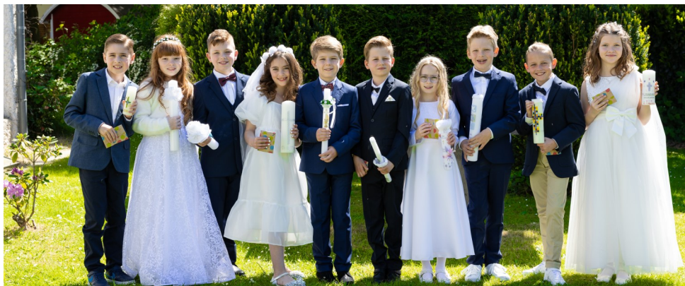
Die Kommunionkinder 2024 von St. Laurentius