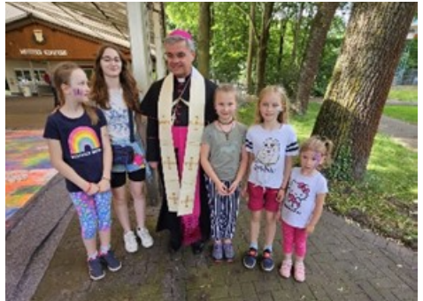
Die Kinder aus St. Walburga bei der Kinderwallfahrt