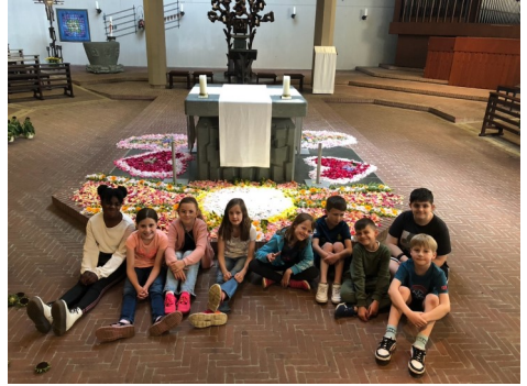
Die Kommunionkinder aus Bad Oeynhausen vor dem geschmückten Altar in St. Peter und Paul (alle Fotos privat).