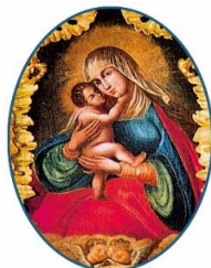
MARIA HILF MOOSBRONN

Anlässlich des Jubiläums „275 Jahre Pfarr- und Wallfahrtskirche Maria Hilf, Moosbronn“ lädt das Gemeindeteam Maria Hilf recht herzlich zu einer Gesprächsrunde ein. Termin: Sonntag, 07. Juli um 16.00 Uhr im Haus Bruder Klaus, Herrenalber Straße 14, Moosbronn. Das Gemeindeteam freut sich auf Ihr Kommen und auf Ihre Erzählungen und Erlebnisse in und rund um Maria Hilf, Moosbronn. Anmeldung: Pfarrbüro St. Josef, Tel. 07225 1470, Mail: pfarrbuero@kath-gaggenau.de.