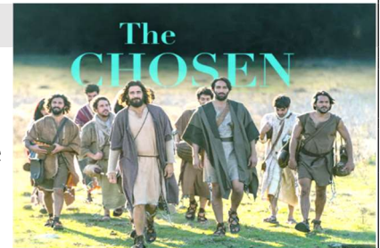
The Chosen, Inc.

Wir laden herzlich ein !!!! Gemeinsam diese großartige Serie „The CHOSEN“ (1. Staffel) anzuschauen und das Leben Jesus zu betrachten!