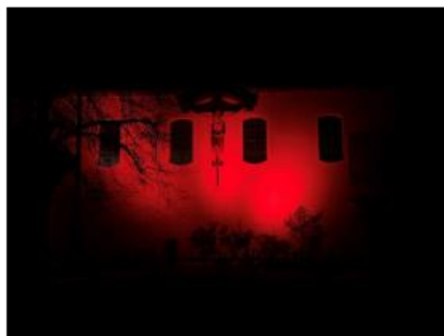
Rot angestrahlte Fassade von St. Heinrich

Mit dem „Red Wednesday“ am 20. November 2024 macht das internationale katholische Hilfswerk KIRCHE IN NOT auf das Schicksal von Millionen verfolgten, unterdrückten und bedrohten Christen auf der ganzen Welt aufmerksam.