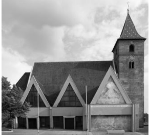
St. Jakobus, Ornau