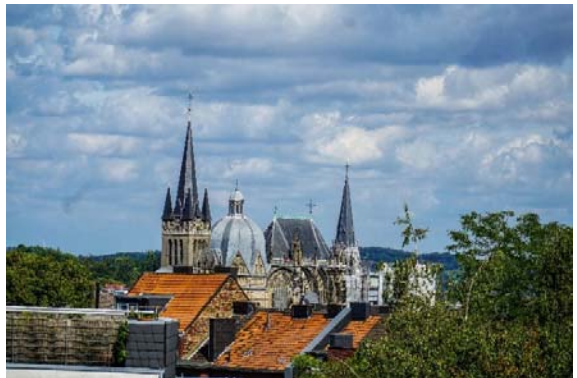
Aachener Dom

Man betritt den Innenraum, wenn die Kirche eine gewisse Bekanntheit hat, oder zumindest in einer großen Stadt steht, gibt es neben Broschüren vermutlich auch schon die Möglichkeit sich digital etwas anzuhören, möglicherweise gibt es auch irgendwo einen Shop, der Erinnerungsstücke verkauft, deren Preis dann zum Erhalt der Kirche dienen mag.