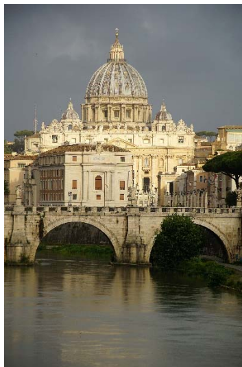
Petersdom - Rom

Man betritt den Innenraum, wenn die Kirche eine gewisse Bekanntheit hat, oder zumindest in einer großen Stadt steht, gibt es neben Broschüren vermutlich auch schon die Möglichkeit sich digital etwas anzuhören, möglicherweise gibt es auch irgendwo einen Shop, der Erinnerungsstücke verkauft, deren Preis dann zum Erhalt der Kirche dienen mag.