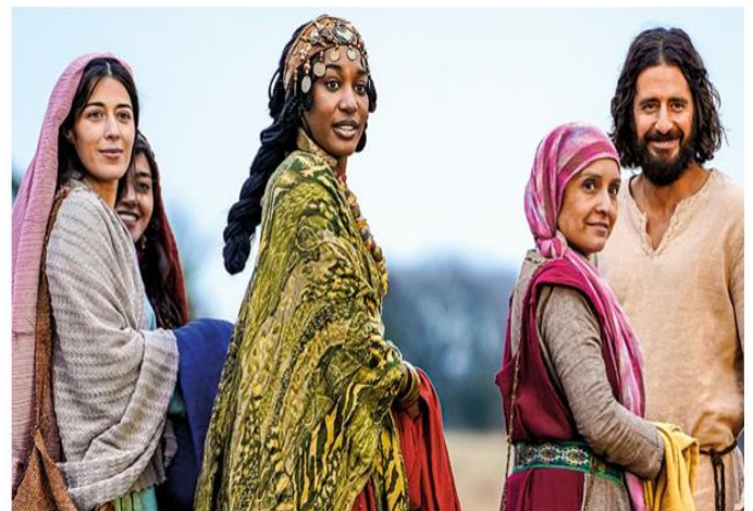
Bildausschnitt aus der Serie The Chosen – Magdalena, Rama, Tamar aus Äthiopien und Maria, treue Begleiterinnen von Jesus

Wenn eine Bambutifrau feststellt, dass sie ein Kind erwartet, bereitet sie Speise und bringt einen Teil davon in den Wald, um sie Gott darzubringen mit den Worten: Gott, von dem ich dieses Kind empfangen habe, nimm und iss' (Schebesta, I, S. 235)