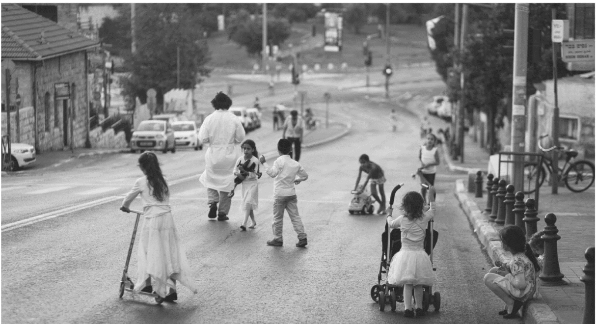
Kinder spielen in weißer Kleidung auf den autofreien Straßen, Foto: KNA-Bild

nigt werdet; von allen euren Sünden werdet ihr gereinigt vor dem Herrn.“ Für Frauen ab 12 und Männer ab 13 Jahren ist er ein Fastentag, an dem 25 Stunden gefastet wird, das heißt, von kurz vor Sonnenuntergang des Vortags bis zum nächsten Sonnenuntergang wird weder flüssige noch feste Nahrung eingenommen. Auch Rauchen ist untersagt. In Israel sind an diesem Tag alle Restaurants und Cafés geschlossen (ausgenommen arabische). Das gesamte öffentliche Leben steht still. Obwohl es kein behördliches Fahrverbot gibt, sind die Straßen fast vollständig autofrei. Von wenigen Ausnahmen abgesehen dauert der Gottesdienst in den jüdischen Gemeinden aller Richtungen beinahe den ganzen Tag.